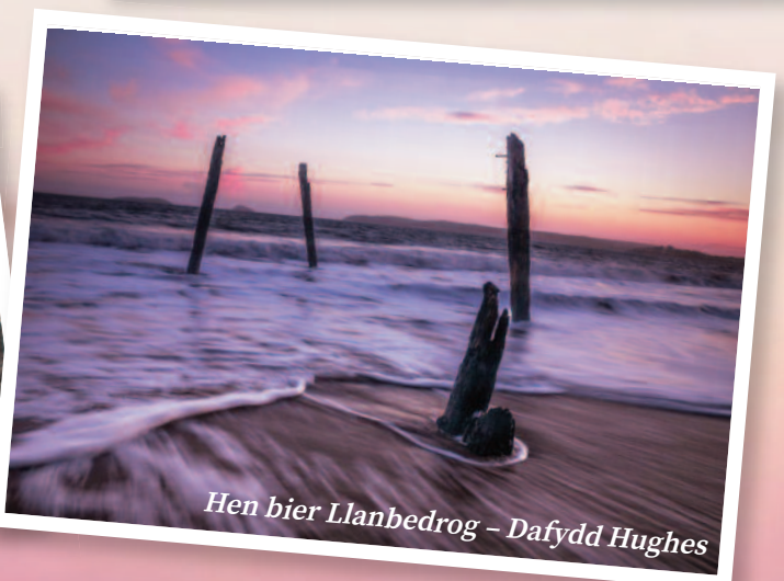
Hen bier Llanbedrog - Dafydd Hughes